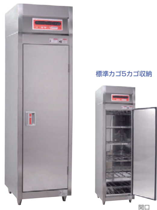
SE I-5AN ※5カゴタイプは100V仕様有り。