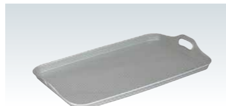
■アルマイト 脇取盆