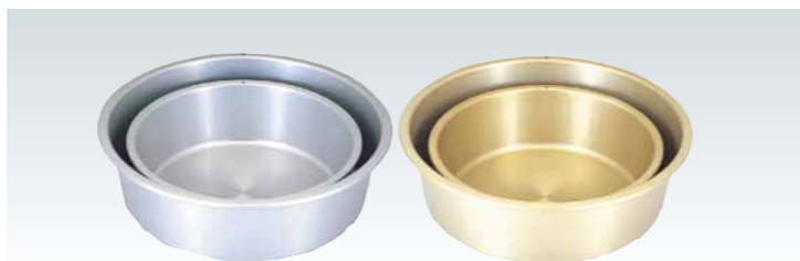
■アルマイトタライ