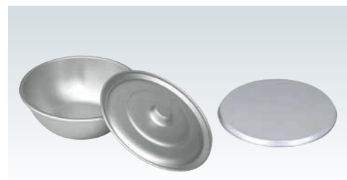
■硫酸アルマイトボール(シルバー)

硫酸(シルバー):酸性に強い。耐食性 蔘酸(ゴールド):酸性・アルカリ性に強い。耐食性3倍