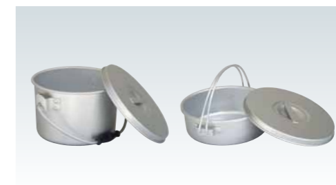
■ジャムバター入れ