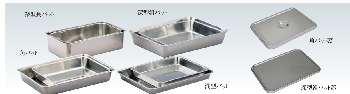
■ステンレス角バット