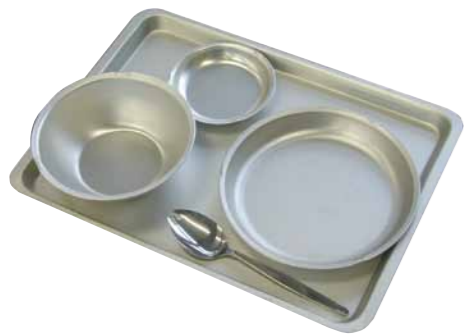
■アルマイト 水切付