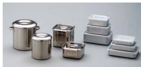
■ステンレスキッチンポット

60×255mm 材質シリコン(耐熱200℃) 芯金属部:ステンレススチール ¥1,300