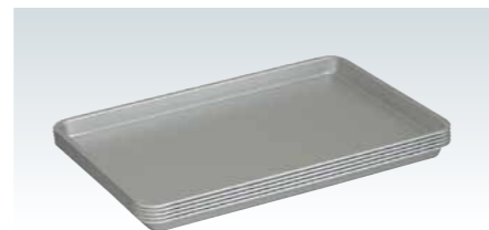
■アルマイト ケーキ盆