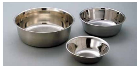
■ステンレス洗桶/タライ