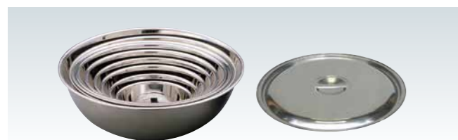
■ステンレスボール