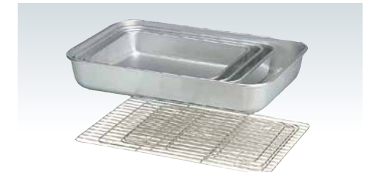
■アルミ深型バット