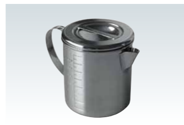
■SNCモリブデンソース入