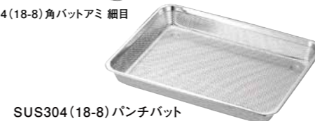
SUS304 (18-8) パンチバット