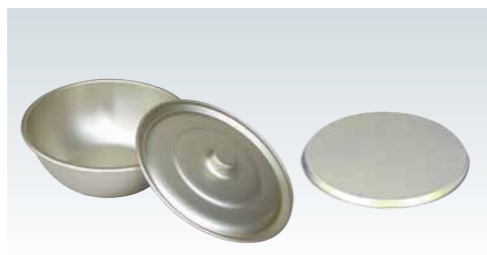
■蔘酸アルマイトボール(ゴールド)