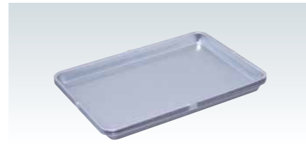
■アルマイト 上イボ付