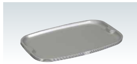
■アルマイト 小判盆