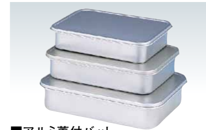
■アルミ蓋付バット