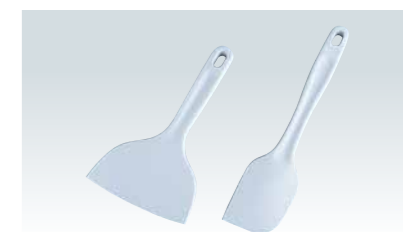
■B-012シリコンモノクリーナーワイド(左)

110×205mm 材質シリコン(耐熱200℃) 芯金属部:ナイロン樹脂 ¥1,750