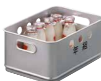
牛乳缶 24本入 370×250×170mm