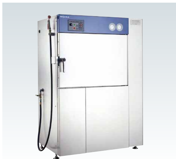
CMJ-40QE ※ホテルパンラック及び棚板はオプションです。 ホテルパンは別途ご用意下さい。